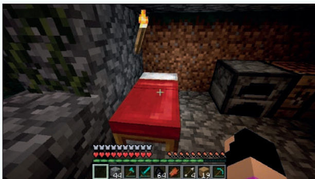
Rysunek 3.6. Łóżko wewnątrz domu