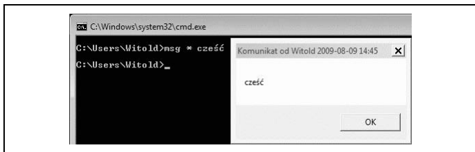
Rysunek 8.7. W oknie konsoli zostało wpisane polecenie wysłania komunikatu. Komunikat ma postać małego okna

3. Zapoznaj się z informacjami wyświetlonymi w oknie konsoli (rysunek 8.7).