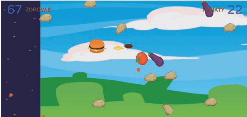
Rysunek W.1. Zrzut ekranu ze środka akcji gry Przygody pana Burgera

Ale wystarczy trudnych wyrazów. Oto zrzut ekranu pokazujący, jak wygląda nasza gra pod koniec książki, w samym środku warzywnej zawieruchy (rysunek W.1).