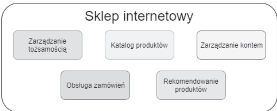
RYСУNEK 1.1. Przykład architektury monolitycznej — zamknięcie wszystkich domen sklepu internetowego w jednym systemie

Z architekturą monolityczną — rysunek 1.1 — miał do czynienia chyba każdy z deweloperów. Cechą charakterystyczną takiej architektury jest zamknięcie wszystkich domen biznesowych w jednym niepodzielnym systemie. Dzięki takiemu podejściu szybciej można pokazać klientowi jakąś wartość biznesową. Z drugiej strony ten typ architektury prowadzi do zwiększenia złożoności i skomplikowania systemu. Wiele komponentów posiada zależności i ciężko wydzielić ich logikę biznesową. Przez takie podejście dużym wyzwaniem staje się skalowanie. Systemy oparte na architekturze monolitycznej nie są dostosowane w szczególności do skalowania wszcz (tworzenia kilku instancji aplikacji).