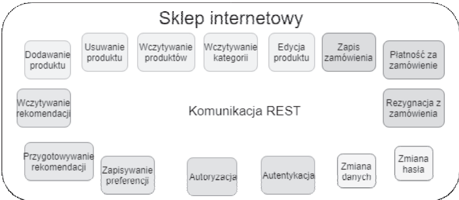
RYСУNEK 1.3. Przykład architektury opartej na funkcjach — każda funkcjonalność sklepu internetowego wydzielona jako osobna funkcja

instancje funkcji pojawiają się w zależności od ilości zapytań. Jeżeli chodzi o minusy tego rozwiązania, to — podobnie jak w przypadku mikroserwisów — najwięcej uwagi należy zwrócić na integrację oraz wdrożenie aplikacji opartej na funkcjach.