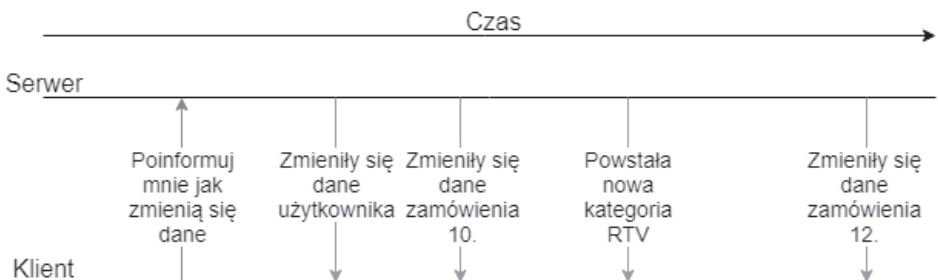
RYСУNEK 1.6. Przykład architektury bazującej na zdarzeniach

Podejście, które zasadniczo zmienia komunikację i jest wykorzystywane w świecie serverless, opiera się na zdarzeniach. W odniesieniu do architektury klient-serwer polega na zwróceniu się klienta do serwera, żeby informował go np. o wszystkich zmianach danych — rysunek 1.6. Gdy dane zmieniają się na serwerze, to informacja o tym bezzwłocznie zostanie przesłana do klienta. Zalety takiego rozwiązania są oczywiste. Klient jednokrotnie zgłasza się do serwera i komunikaty przesyłane są tuż po wystąpieniu zdarzenia.