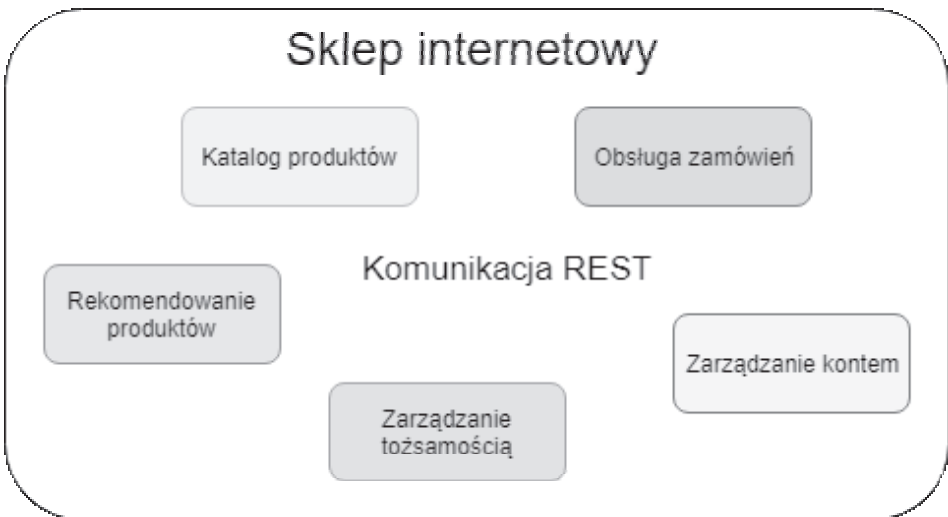
RYСУNEK 1.2. Przykład architektury mikroserwisów — każda domena sklepu internetowego wydzielona jako osobny mikroserwis

Podział na funkcje jest kolejnym krokiem w ewolucji architektury. Projekt rozbity jest na jeszcze mniejsze, niezależnie uruchamiane części, często nazywane nanoserwisami. Wracając do analogii sklepu internetowego — rysunek 1.3 — jedna funkcja może reprezentować funkcjonalność zapisu zamówienia, a inna może być odpowiedzialna za pobranie o nim danych. Tak małe kawałki kodu o wiele łatwiej jest skalować. Przy użyciu platform FaaS nowe