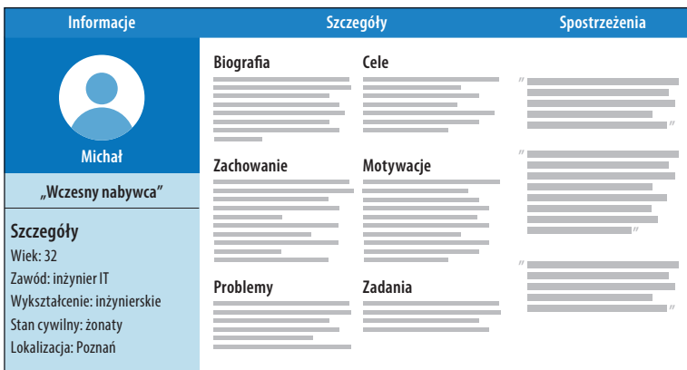
Rysunek 1.5. Przykład persony użytkownika

Czy kiedykolwiek znalazłeś się w sytuacji, w której inny projektant z Twojej firmy lub organizacji mówił coś o „użytkowniku”, ale nie było do końca jasne, kim ta tajemnicza osoba właściwie jest? Proces projektowania staje się trudniejszy, kiedy zespołowi brakuje jasnej definicji grupy docelowej, przez co każdy projektant interpretuje ją po swojemu. Persony użytkowników są narzędziem, które pomaga w rozwiązaniu tego problemu przez oparcie decyzji projektowych na rzeczywistych potrzebach, a nie na domyślnych potrzebach bliżej nieokreślonego „użytkownika”. Takie fikcyjne przedstawienia konkretnych podzbiorów grupy docelowej oparte są na zagregowanych danych rzeczywistych użytkowników produktu lub usługi (rysunek 1.5).