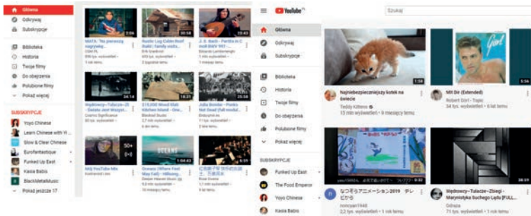
Rysunek 1.2. Aktualizacja serwisu YouTube w roku 2017 — przed (po lewej) i po (po prawej).

Szeroko zakrojone zmiany nie zawsze jednak odstręczają użytkowników — wystarczy spytać Google'a. Google wielokrotnie dawał użytkownikom możliwość samodzielnego zdecydowania o uaktywnieniu przeprojektowanych wersji swoich produktów, takich jak Kalendarz Google, YouTube i Gmail. Kiedy w roku 2017, po latach udostępniania praktycznie niezmiennego projektu serwisu YouTube, firma wypuściła jego nową wersję (rysunek 1.2), użytkownicy komputerów zyskali szansę zapoznania się z nowym interfejsem Material Design, lecz zawsze mieli możliwość cofnięcia tej zmiany. Mogli przejrzeć nowy układ interfejsu, zaznajomić się z nim, zgłosić uwagi, a nawet powrócić do poprzedniej wersji. Nieuchronny dysonans modeli mentalnych został złagodzony dzięki temu, że dano użytkownikom możliwość przejścia do nowej wersji serwisu wtedy, kiedy będą na to gotowi.