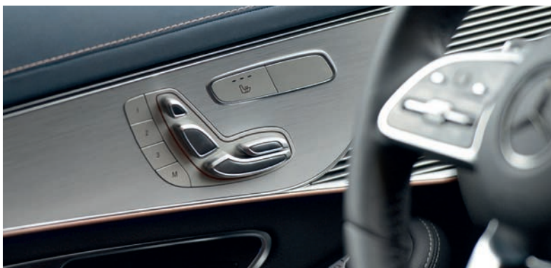
Rysunek 1.4. Kontrolki regulacji fotela w Mercedes-Benz EQC 400 Prototype z 2020 roku, oparte na modelu mentalnym fotela samochodowego

Kierowanie się modelami mentalnymi w projektowaniu nie ogranicza się do przestrzeni cyfrowej. Niektórych z moich ulubionych przykładów dostarcza przemysł motoryzacyjny, w szczególności w odniesieniu do kontrollek. Rozważmy przykład Mercedes-Benz EQC 400 Prototype z 2020 roku (rysunek 1.4). Kontrolki ustawienia fotela znajdujące się na panelu drzwiowym obok każdego siedzenia mają kształt samego fotela. Dzięki temu użytkownik może z łatwością zorientować się, którą część fotela będzie regulować. To wydajny projekt, ponieważ wykorzystuje istniejący model mentalny fotela samochodowego i dostosowuje do niego kontrolki.