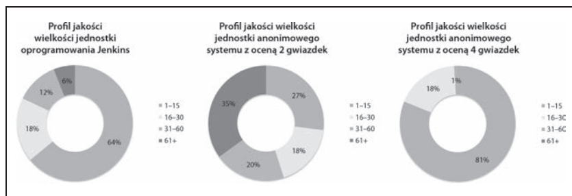
Rysunek 1.1. Przykład trzech profili jakości

Systemy w rankingu są uszeregowane na podstawie ich metrycznych profili jakości. Na rysunku 1.1 przedstawione zostały trzy przykłady profili jakości wielkości jednostki (czytelnicy papierowego wydania książki mogą obejrzeć kolorowe wersje tego i kolejnych rysunków, korzystając z repozytorium opracowanego dla potrzeb publikacji: ftp://ftp.helion.pl/przyklady/oplaut.zip ).