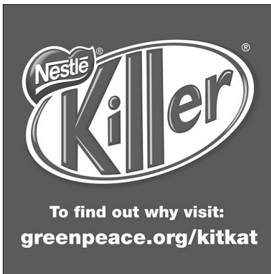
Rysunek 6.1 Osoby krytykujące Nestlé w internecie mogły się wyżyć, wykorzystując swoje zdolności graficzne do stworzenia alternatywnych wersji logo firmy, zwracających uwagę na kampanię

Komentarze były częścią wymierzonej w Nestlé kampanii Greenpeace, która wystartowała w tym samym tygodniu po opublikowaniu raportu dowodzącego, że producent słodczy kupuje olej palmowy od dostawcy odpowiedzialnego za wycinkę lasów w Indonezji i śmierć tysięcy orangutanów 2 . Komentarze zostawiane przez użytkowników były różnej treści: jedni wyjaśniali, dlaczego przestają kupować produkty Nestlé, inni zamieszczali przerobione logo Nestlé, gdzie napis Kit Kat zastąpiono słowem „Killer” (ang. morderca) (zob. rysunek 6.1), albo do tradycyjnego logo korporacji dodawano krwawe ślady orangutana.