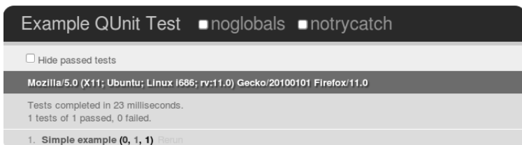
Rysunek 5.1. Rezultat wykonania prostego testu w QUnit

jest asercja ok(value) . Jeśli wartość value jest prawdziwa, wówczas test zakończony zostaje sukcesem. Po umieszczeniu powyższego kodu w pliku tests.js i uruchomieniu w przeglądarce strony z listingu 5.1 zobaczymy wynik uruchomienia testów pokazany na rysunku 5.1.