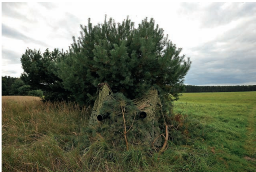
Fotografia 4.12. „Na szybko” rozwieszona siatka maskująca, pod którą oczekujemy na wyjście zwierząt z lasu