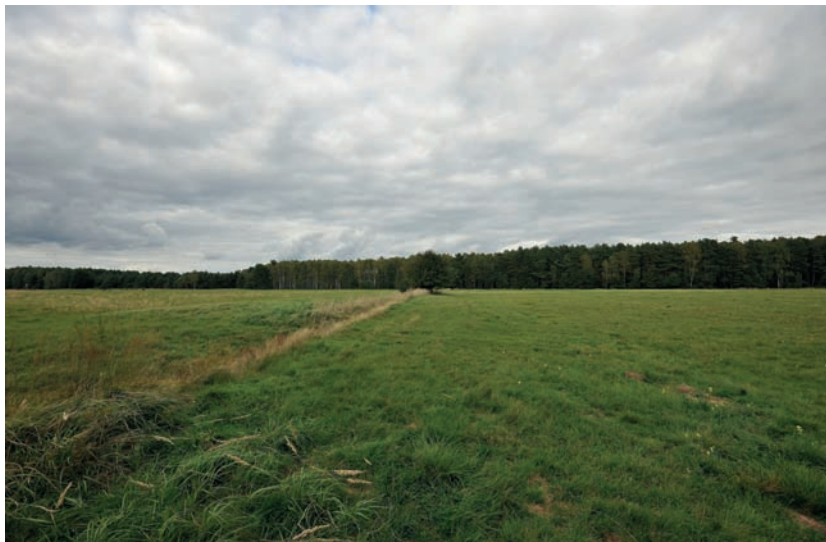
Fotografia 4.11. Ściana lasu, z którego prawdopodobnie wieczorem wyjdą jelenie. Ważnym elementem rozstawienia zsiadki jest rów, który w wypadku konieczności podchodzenia jest naturalną osłoną dającą możliwość na zbliżenie się do zwierząt