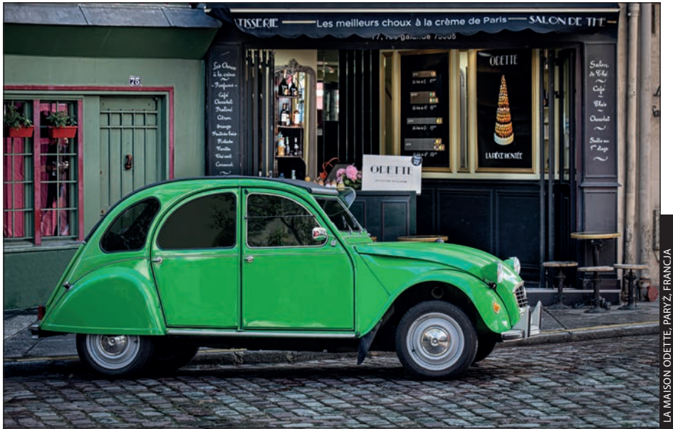
LA MAISON ODETTE, PARYŻ, FRANCJA

Pamiętam, jak pewnego dnia spacerowałem z żoną po nabrzeżu portowym, do którego zamówiono mnóstwo małych łodzi, ale zamiast robić im zdjęcia po prostu siedłem przed siebie, mijając ich dziesiątki. Wreszcie moja żona przystanęła, wskazała pobliską łódź i zapytała: „Co z nią nie tak? Wygląda uroczo”. Zgodziłem się — była urocza — ale miałem też inne zdanie. „Widzisz ten wielki silnik Mercury Marine uciepiony do rufy? Zabija cały urok i romantyczność tej sceny. Szukam zwykłej, prostej łodzi wiosłowej. Tylko wiosła. Żadnego wielkiego motoru. Żadnych plastikowych butelek walających się po dnie. Żadnego radia, foliowych toreb. Nic, co pozwoliłoby określić czas zrobienia zdjęcia”. Zrozumiała mnie bez dalszych wyjaśnień i wraz ze mną zaczęła szukać takiej urzekającej łodzi. Oczywiście możesz robić świetne, nowoczesne zdjęcia, ale to jak naklejenie na fotkę informacji o dacie wykonania. Jeśli uda Ci się skomponować kadr tak, by nie było w nim widać świadczących o współczesności napisów albo samochodów w tle, zyskasz okazję do pokazania widzowi obrazu ponadczasowego — pełnego uroku, romantyzmu i okazji do własnych interpretacji. Poza tym szukanie takich scen jest po prostu przyjemne. Może nie zawsze łatwe, ale jeśli uda Ci się skomponować ów idealny ponadczasowy kadr, przekonasz się, że było warto.