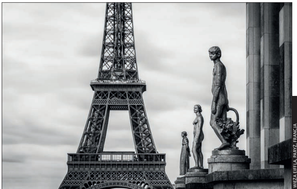
WIEŻA EIFFLA, PARYŻ, FRANCJA