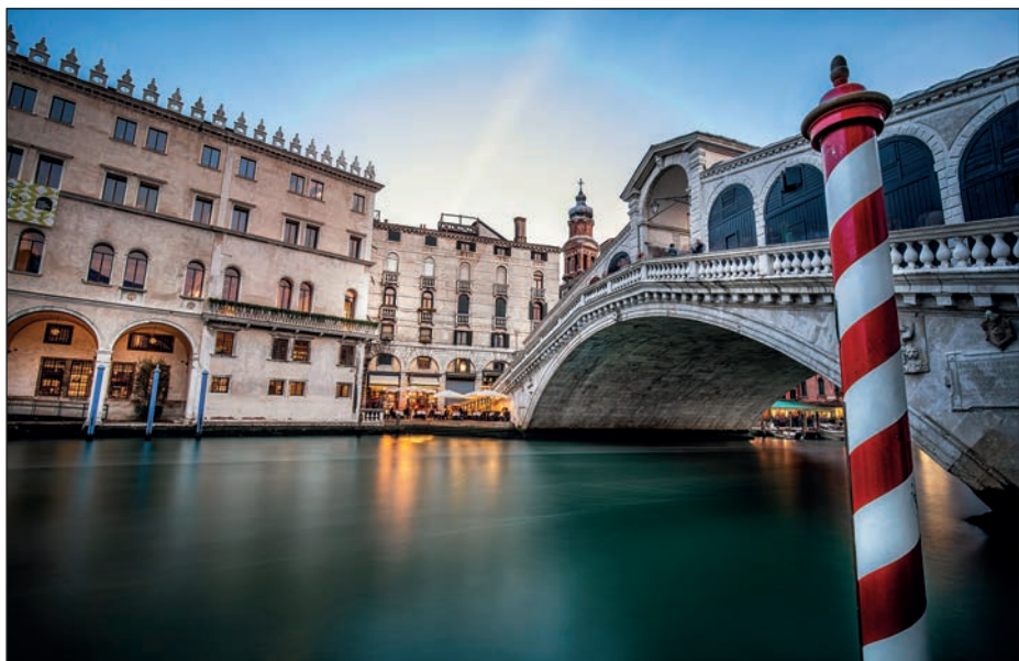
MOST RIALTO, WENECJA, WŁOCHY

Dobre zdjęcia z podróży nie są rozmyte. Nie są trochę nieostre. Jeśli patrząc na zdjęcie zadajesz sobie pytanie: „Czy ono jest ostre?“, znaczy to, że nie jest. Świetne fotografie podróżnicze mogą być naturalnie miękkie — takie jak zrobiona o poranku fotka wśród unoszących się mgieł — ale nie mogą być nieostre. Przejrzyj na Instagramie zdjęcia dowolnych świetnych fotografów-podróżników. Czy przy którymkolwiek pomyślisz sobie: „Hmm, to zdjęcie wygląda na trochę nieostre...”? Nie. Ci spece dbają o perfekcyjne ustawianie ostrości, ponieważ (powiedz to razem ze mną): „Znakomite zdjęcia z podróży są ostre”. Gdy światła jest mało i czas naświetlania się wydłuża (co nie stanowi problemu podczas fotografowania w plenerze w słoneczny dzień), może Ci się przydać lekki statyw albo platy pod. Kiedy zobaczysz, jak ostre i wyraziste są zrobione przy ich użyciu zdjęcia, przekonasz się, że warto było zabrać dodatkowe akcesorium. Jeśli zrobisz zadowolająco wyraziste zdjęcie, możesz przy użyciu Photoshopa czy Lightrooma przemienić je w ostre jak żyletka — dostępne w tych programach narzędzia do wyostrania są znakomite (więcej na ten temat możesz przeczytać w rozdziale 12.). Ale jeżeli zrobisz rozmyte zdjęcie, te programy jedynie złagodzą rozmycie — nie wyczarują z niego ostrego obrazu. O to musisz zadbać już w aparacie.