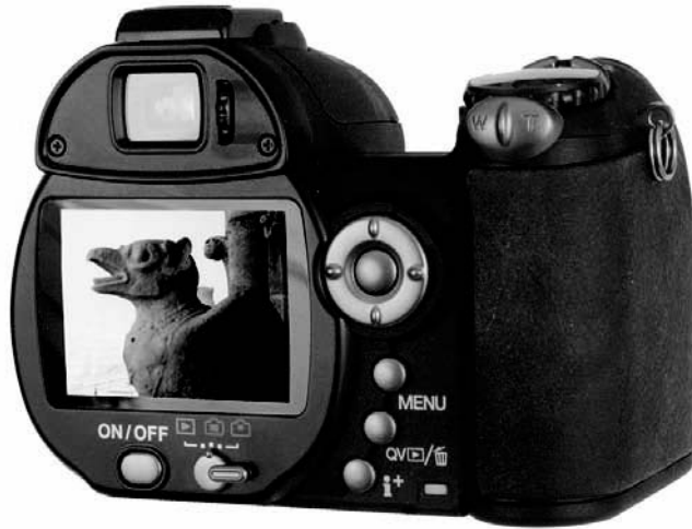
Rysunek 1.1. Aparaty przeznaczone dla entuzjastów fotografii mogą być wyposażone zarówno w duży wyświetlacz LCD, jak i wewnętrzny wizjer elektroniczny

czyli 300 – 360 mm. Wydając od 2000 do 2500 złotych, otrzymamy aparat o rozdzielczości od 8 do 10 megapikseli z dużym 2,5-calowym wyświetlaczem LCD na tylnej ścianie i drugim, wewnętrznym wyświetlaczem pełniącym rolę wizjera, który pokazuje niemal dokładnie to, co widzi obiektyw. Takie aparaty często kupują zaawansowani fotoamatorzy, bo dzięki ich niskiej cenie mogą sobie pozwolić na zakup dodatkowych akcesoriów. Także profesjonalści czasami używają tych aparatów do robienia prywatnych zdjęć lub jako tani dodatkowy aparat będący uzupełnieniem ich profesjonalnego sprzętu.