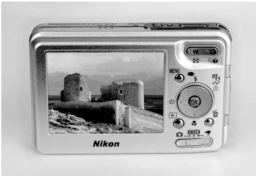
Rysunek 1.3. Aparat z dużym wyświetlaczem LCD, ale bez dodatkowego wizjera, świetnie nadaje się do przeglądania zdjęć, natomiast używanie go w silnym świetle słonecznym może być trudne