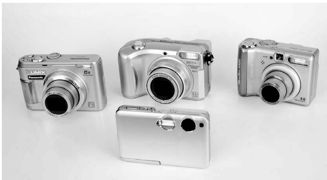
Rysunek 1.6. Mały aparat mieści się w każdej kieszeni, dzięki czemu może być zawsze pod ręką

W poradnikach dla podróżujących można przeczytać, że bagaż powinien być jak najlżejszy. W pewnym zakresie można to odnieść również do sprzętu fotograficznego. Jeśli ktoś naprawdę chce go zminimalizować, może wybrać aparat wyposażony we wszystkie niezbędne funkcje, a przy tym mniejszy od paszportu i niewiele od niego grubszy. Natomiast jeśli chce mieć aparat z obiektywem o większym zoomie (lub z wymiennymi obiektywami), silniejszą lampą błyskową i różnymi dodatkowymi funkcjami, musi liczyć się z tym, że jego bagaż będzie większy. Wybierając aparat pod kątem fotografii podróżniczej, należy zatem ustalić, czy jego waga i rozmiary mają znaczenie.