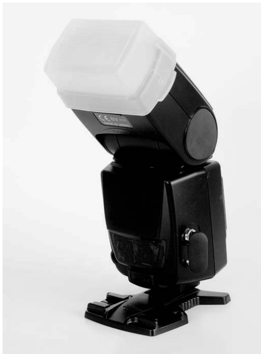
Rysunek 1.5. Zewnętrzną lampę błyskową można zamontować na aparacie lub poza nim, łącząc oba urządzenia odpowiednim przewodem — takie rozwiązanie umożliwia oświetlenie obiektu pod innym kątem