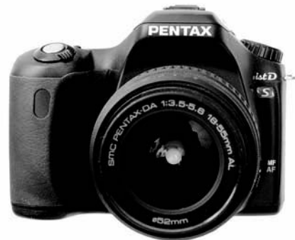
Rysunek 1.2. Cyfrowe lustrzanki jednoobiektywowe charakteryzują się wymiennością obiektywów, szybkim działaniem i dużą liczbą dodatkowych funkcji

frustrującego opóźnienia, jakie występuje między naciśnięciem spustu migawki a faktycznym zarejestrowaniem obrazu. Półprofesjonalna lustrzanka kosztuje od około 2000 do 3500 złotych (do tego należy dodać od 500 do 1000 złotych za obiektyw), a za model profesjonalny trzeba zapłacić od 3500 do 15 000 złotych lub jeszcze więcej. Rozdzielczości dostępne w tej kategorii aparatów zawierają się w przedziale od 6 do 16 megapikseli.