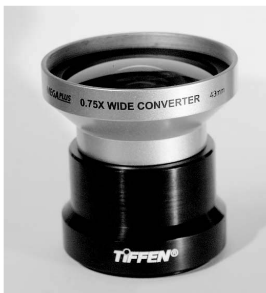
Rysunek 1.4. Taka nakładka nałożona na obiektyw aparatu kompaktowego zwiększa jego kąt widzenia

mają wymiennych obiektywów, ale na wielu z nich można zamontować nasadkę powodującą skrócenie lub wydłużenie ogniskowej głównego obiektywu. Nasadki tego typu są zakładane na przednią część obiektywu. Ich koszt z reguły nie przekracza 300 złotych. Jeśli nasz aparat nie jest wyposażony w obiektyw z „superzoomem” (czyli ośmio- do dwunastokrotnym), taka nasadka może być dobrą inwestycją, dzięki której może nawet będziemy mogli odłożyć zakup nowego aparatu.