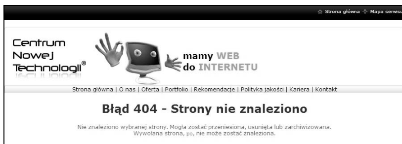
Rysunek 3.4. Jak radzić sobie z błędem 404

gdy wpisze błędnie adres strony. Takie złe wrażenie można jednak zniwelować. Wystarczy, że pod adres domeny ustawisz wyświetlanie się góry strony wraz z menu, bez względu na to, jaki nieprawidłowy adres podstrony by się wpisało w pasek przeglądarki. Posłużę się przykładem strony mojej firmy. Portfolio jest dostępne pod adresem www.cntech.pl/portfolio , lecz gdyby podczas wpisywania adresu namieszał jakiś chochlik i zamiast „portfolio” byłoby słowo „portolio”, pojawi się strona z naszym logo, hasłem, menu oraz standardowym komunikatem, że strona nie została odnaleziona (rysunek 3.4). Dzięki widocznemu i aktywnemu menu można próbować ją odnaleźć. Przede wszystkim jednak użytkownik otrzymuje jasny sygnał: strona wciąż działa, co w przypadku strony firmowej oznacza: „jeszcze się nie zwinęli”.