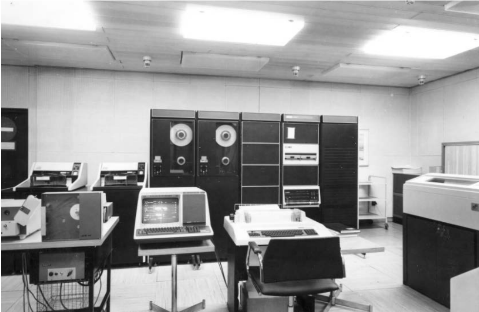
RYSUNEK 0.3. System PDP-11/70 5

roku wspierała przetwarzanie w modelu klient-serwer, natomiast szósta przyniosła ulepszenia w zakresie skalowalności oraz tworzenia kopii zapasowych.