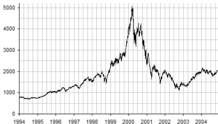
RYSUNEK 0.4. Wykres indeksu giełdowego NASDAQ Composite w latach 1994 – 2005 ze szczytem na początku 2000 roku 6

Teraz bazy danych są naszą codziennością. Korzystamy z nich na co dzień, choć — jak wspomniano we wstępie — nie zawsze w sposób świadomy.